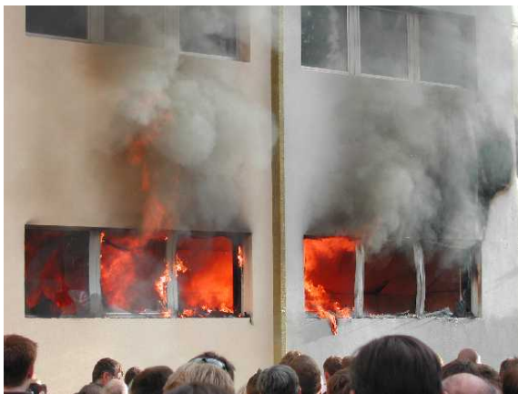
Foto: Homlokzati tűzterjedési vizsgálat 27. perc